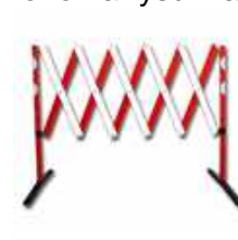
Barierka sztywna rozsuwana